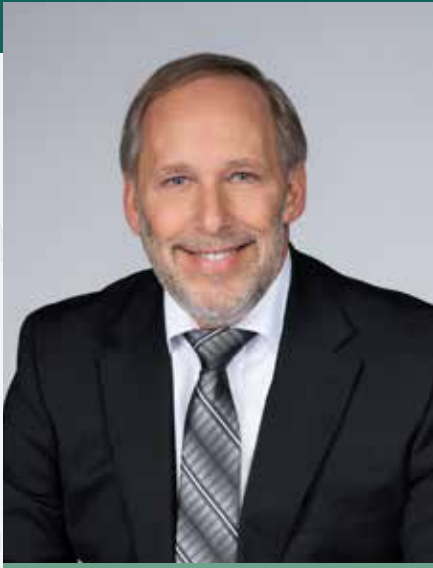
NORMAND DYOTTE MAIRE

Plan stratégique de développement 2018-2033